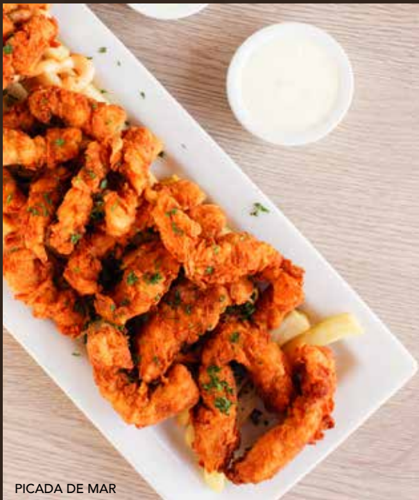
PICADA DE MAR