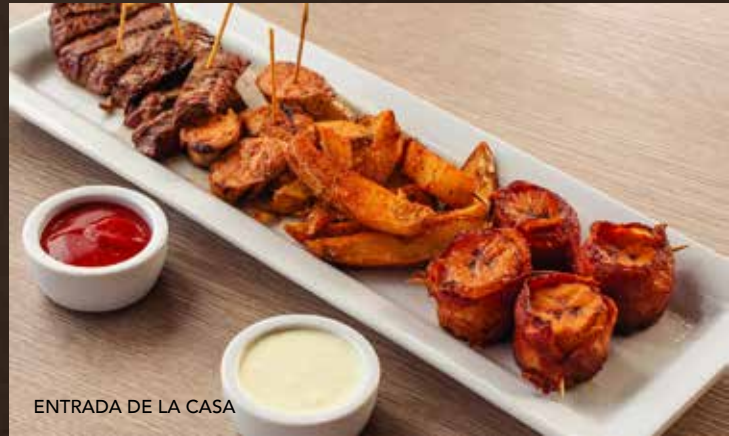
ENTRADA DE LA CASA

Calamar, camarones y trocitos de pescado empanizados, servidos con aderezos y cebolla encurtida. Guarniciones: tostones de plátano y yuca al mojo. | $16.95