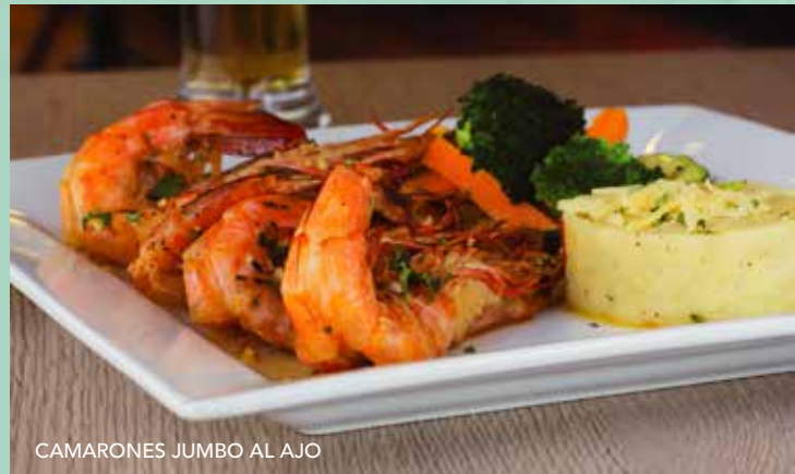
CAMARONES JUMBO AL AJO