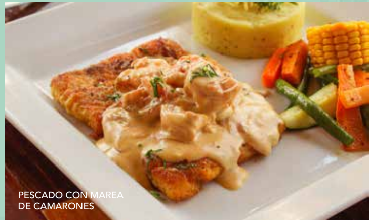
PESCADO CON MAREA DE CAMARONES

Filete de salmón preparado con mantequilla de ajo y eneldo. Servido con puré de papas y vegetales. | $12.95