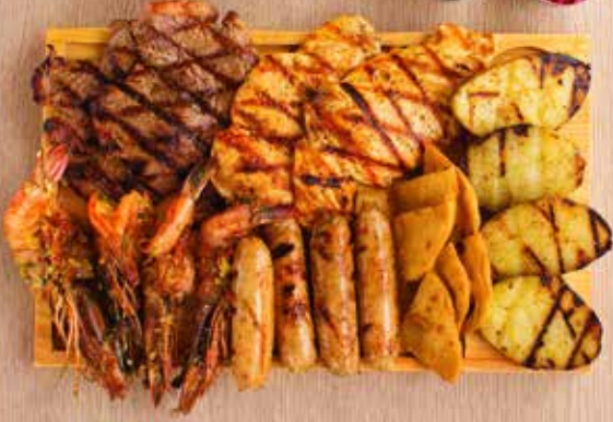
PARRILLADA MAR Y TIERRA