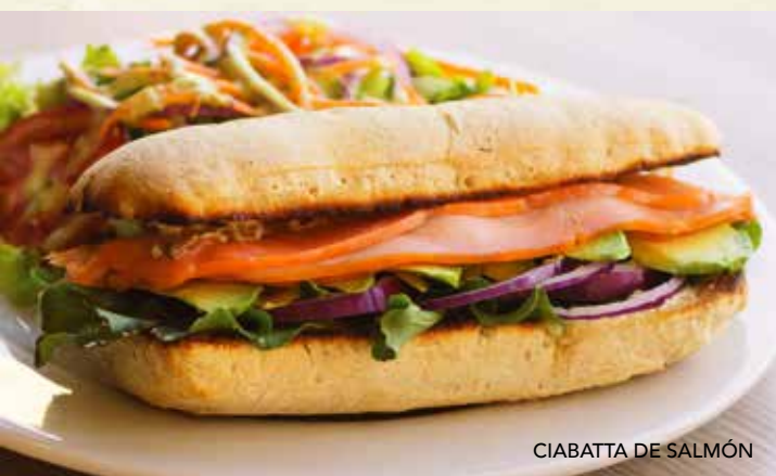
CIABATTA DE SALMÓN