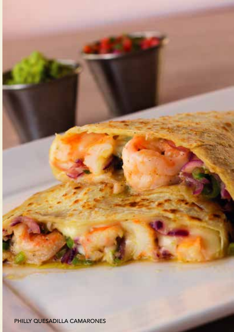
PHILLY QUESADILLA CAMARONES