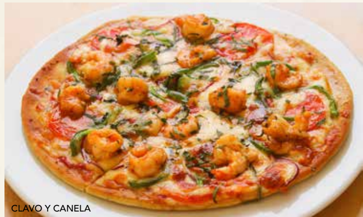
CLAVO Y CANELA