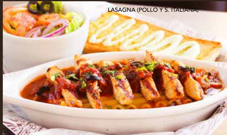
LASAGNA (POLLO Y S. ITALIANA)