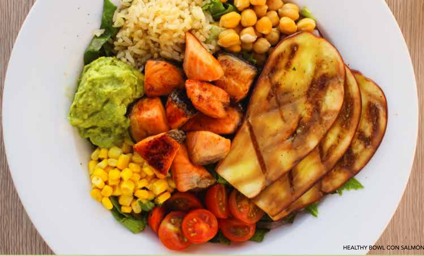
HEALTHY BOWL CON SALMÓN