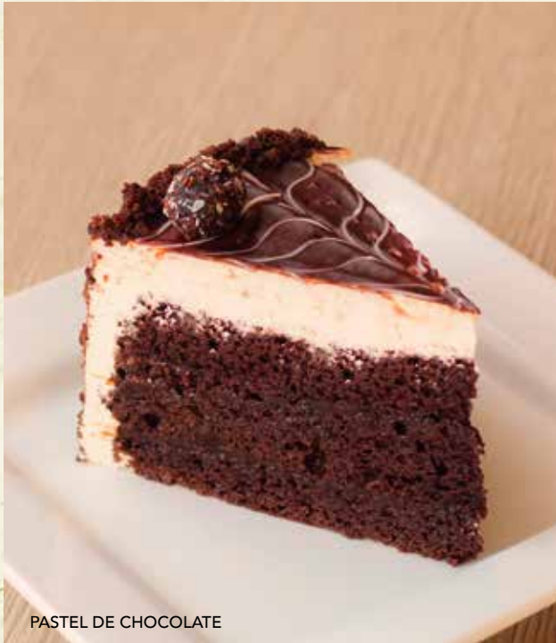
PASTEL DE CHOCOLATE