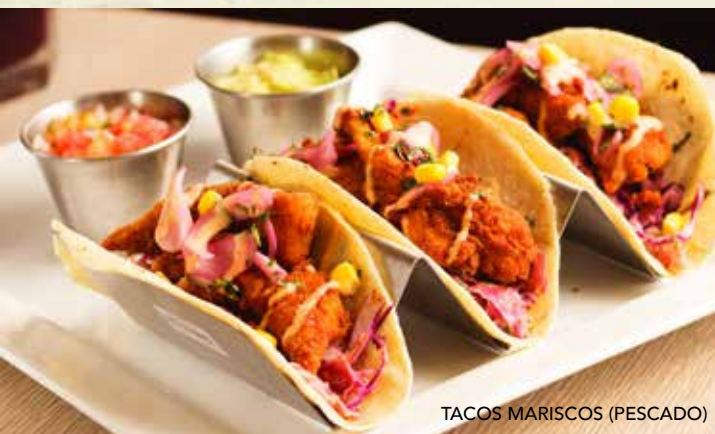
TACOS MARISCOS (PESCADO)