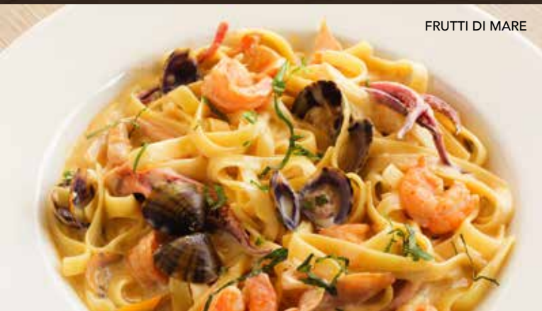
FRUTTI DI MARE