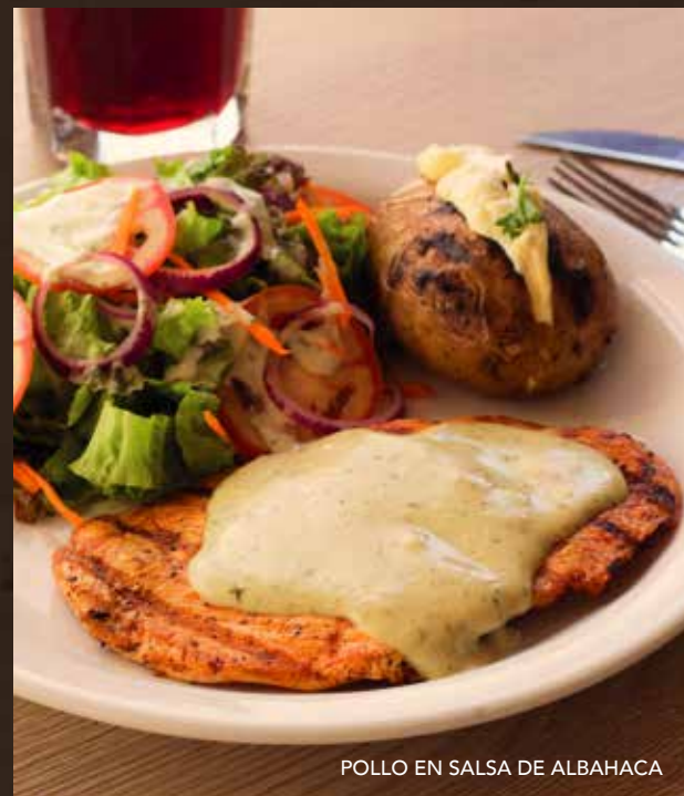
POLLO EN SALSA DE ALBAHACA

Filete de pollo gratinado y bañado con salsa italiana, servido con pasta al cilantro y espina-cas salteadas. | $6.95