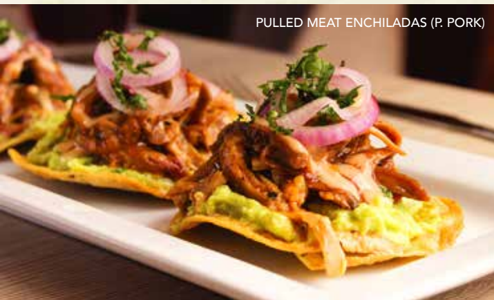
PULLED MEAT ENCHILADAS (P. PORK)

Carne de res mechada, yuca al mojo de ajo, tostones de plátano, arroz blanco y cebolla encurtida. | $7.95