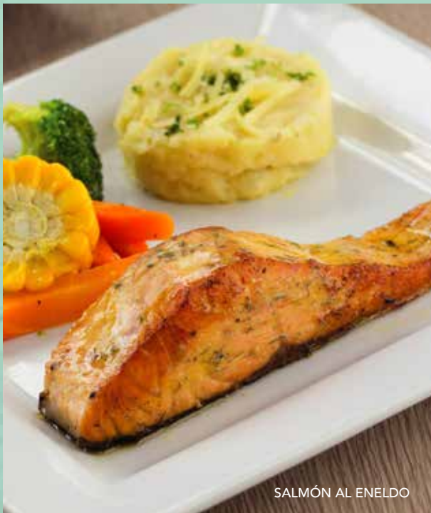
SALMÓN AL ENELDO