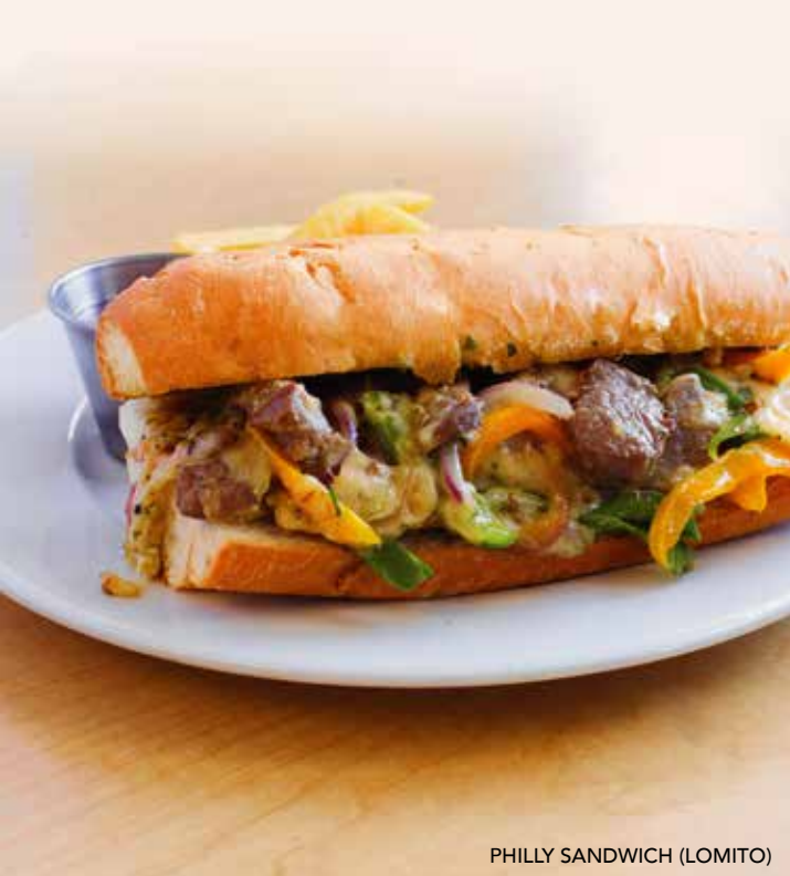
PHILLY SANDWICH (LOMITO)