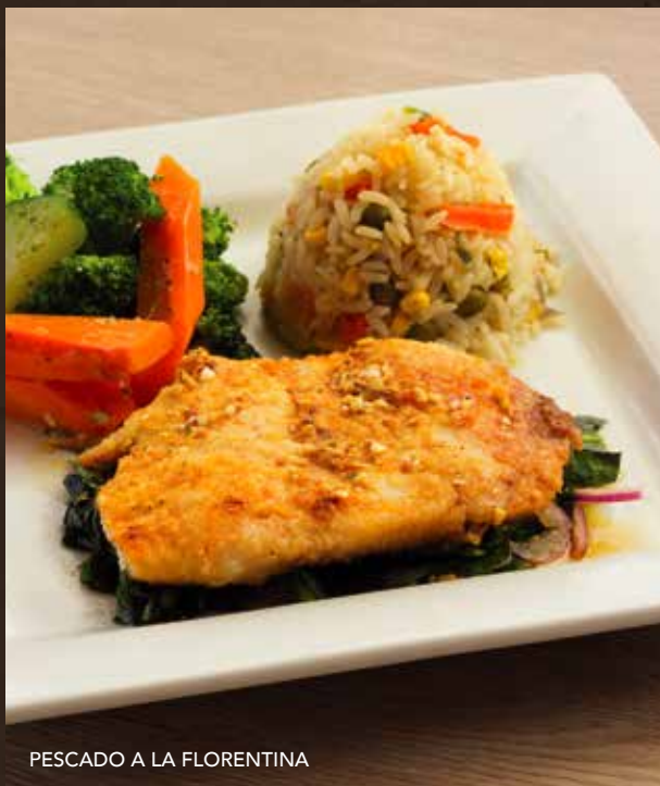
PESCADO A LA FLORENTINA

Filete de pescado al ajo montado sobre una cama de espinacas salteadas, servido con arroz y vegetales. | $8.25