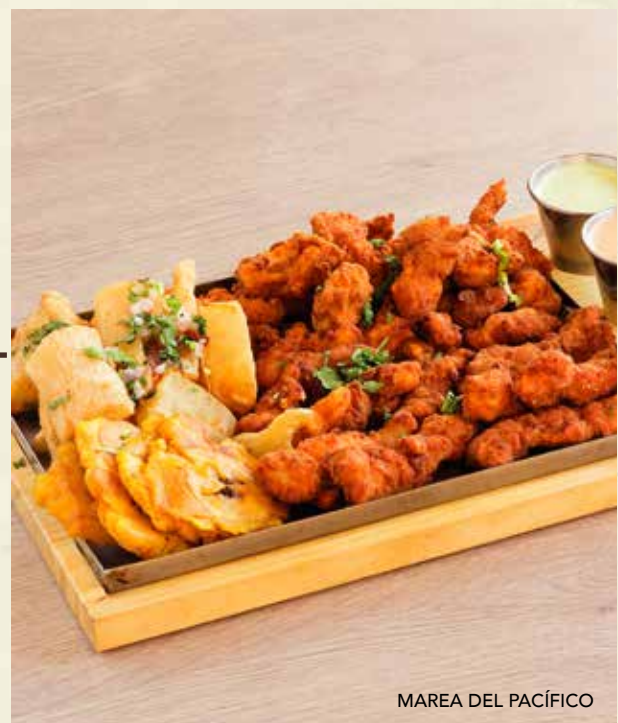
MAREA DEL PACÍFICO

Calamar, camarones y trocitos de pescado empanizados, servidos con aderezos y cebolla encurtida. Guarniciones: tostones de plátano y yuca al mojo. | $16.95