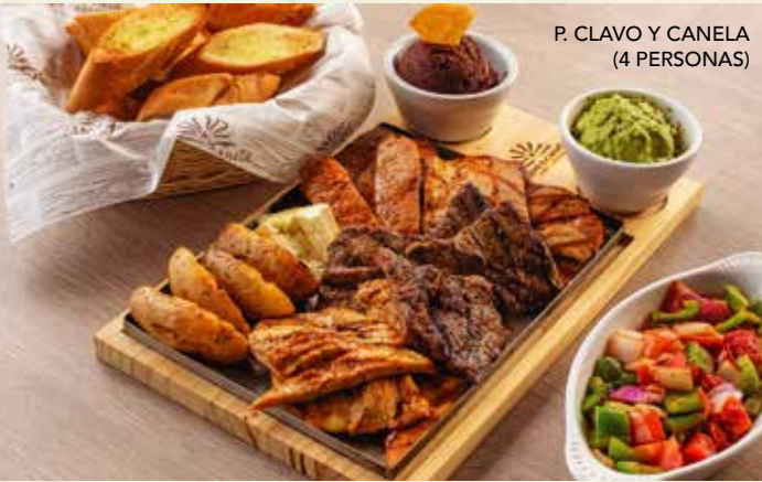
P. CLAVO Y CANELA (4 PERSONAS)

Filetes de puyazo, filetes de pollo, 4 chorizos, casamiento, tortilla frita, papas parrilladas, chimichurri y cebolla encurtida. | $29.75