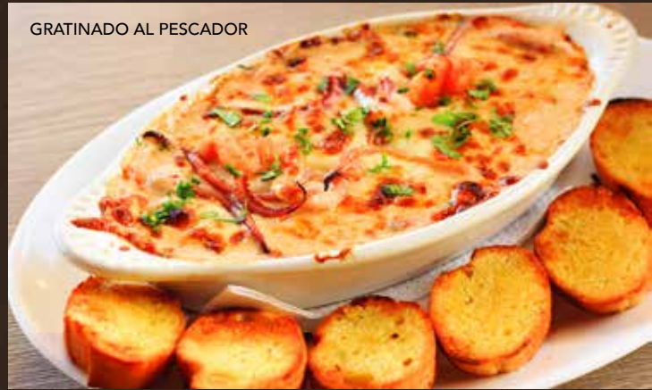
GRATINADO AL PESCADOR